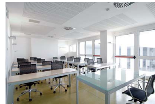
Aula corsi presso la Fondazione